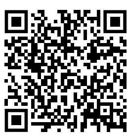
БАЗА ЗНАНЬ НАЗК