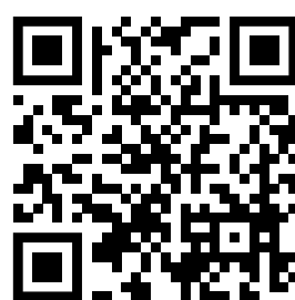
ДЕ ОТРИМАТИ КЕП